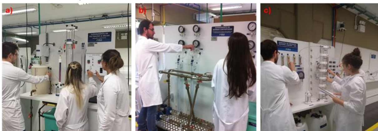
Figura 6: Laboratório Operações Unitárias em aula prática nas bancadas de a) Filtração, b) Bombas e c) Adsorção.

As Figuras 6, 7 e 8 apresentam, respectivamente, o Laboratório de Operações Unitárias durante a realização de aulas práticas em bancadas, as atividades práticas de Tecnologia de Alimentos desenvolvidas na Cozinha Industrial e a estrutura dos laboratórios CLEAN, bem como os equipamentos empregados nessas atividades.