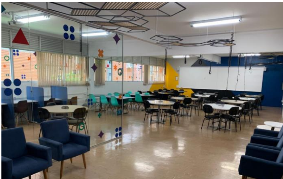
Figura 5: Espaço do Conhecimento Compartilhado – Campus Professor Edison Villela (Itajaí) – Setor B6