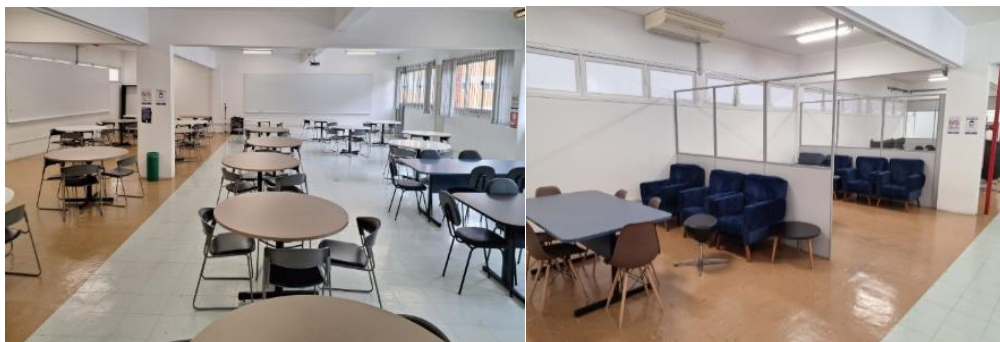
Figura 3: Espaço do Conhecimento Compartilhado – Campus Professor Edison Villela (Itajaí) – Setor F4