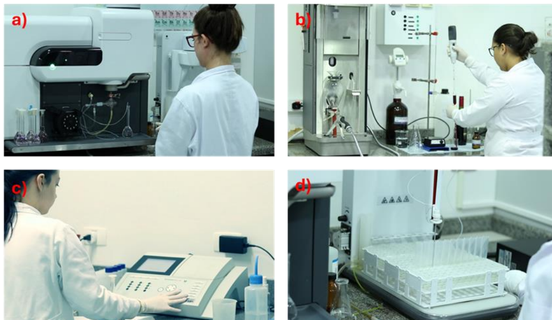
Figura 8: Estrutura de laboratórios CLEAN, equipamento a) Absorção atômica, b) Destilador de vinhos, c) espectrofotômetro e d) Auto amostrador de Absorção Atômica.