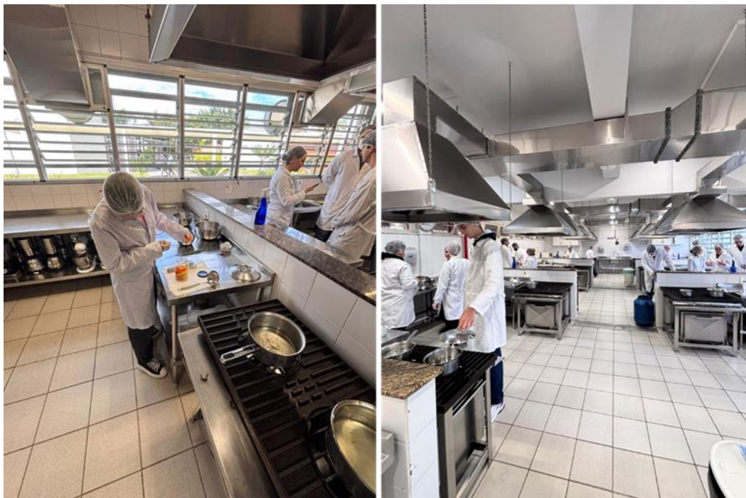
Figura 7: Aulas Práticas de Tecnologia de Alimentos na Cozinha Industrial.